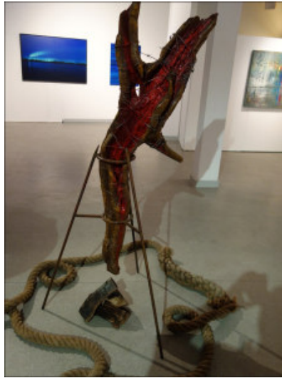
Skulptur von Iris Weissschuh.

Eröffnet wird die Sonderausstellung im Museum der Deutschen Binnenschifffahrt am Sonntag, 22. April, um 11 Uhr in Anwesenheit der Künstler. Statt einer Rede wird es nach der Begrüßung ein Künstlergespräch geben. Die Schau läuft bis zum 21. Oktober. Das Museum ist dienstags bis sonntags zwischen 10 und 17 Uhr geöffnet. An Feiertagen gelten Sonderregelungen. Der Eintritt kostet für Erwachsene 4,50 Euro (Kinder 2,00 Euro) und beinhaltet den Zugang zur Dauer- und Sonderausstellung. Besitzer der Ruhr-Topcard sind einmal im Jahr mit freiem Eintritt dabei. Das Binnenschifffahrtsmuseum befindet sich im denkmalgeschützten Bau des ehemaligen Ruhrorter Stadtbades an der Apostelstraße 84. Am Leinpfad – auf dem Weg zu den Museumsschiffen – kann man die aktuellen großformatigen Fotoarbeiten betrachten. Mehr auf http://www.binnenschifffahrtsmuseum.de .