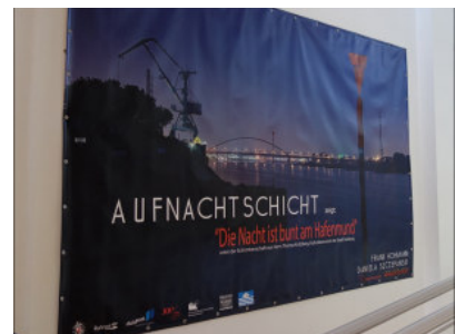
Das Plakat hing zwei Jahre lang am Leinpfad.