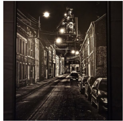
Fotografie von Frank Hohmann. Foto: Petra Grünendahl.