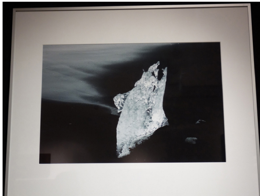
Fotografien von Daniela Szczepanski. Foto: Petra Grünendahl.

© 2018 Petra Grünendahl (Text und Fotos)